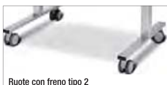
Ruote con freno tipo 2

È particolarmente indicato anche per utenti in carrozzina: l'accesso è semplice per via della regolazione in altezza, e gli accessori come gli appoggia braccia conferiscono un supporto ottimale nell'impiego. I supporti per avambracci possono essere facilmente montati agganciandoli alla guida.